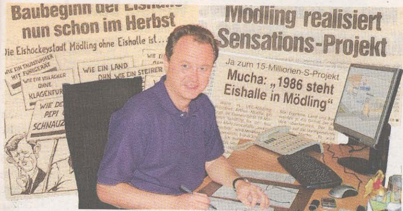
Was lange währt, wird endlich gut? - Die Entscheidungen der kommenden Woche werden es zeigen.